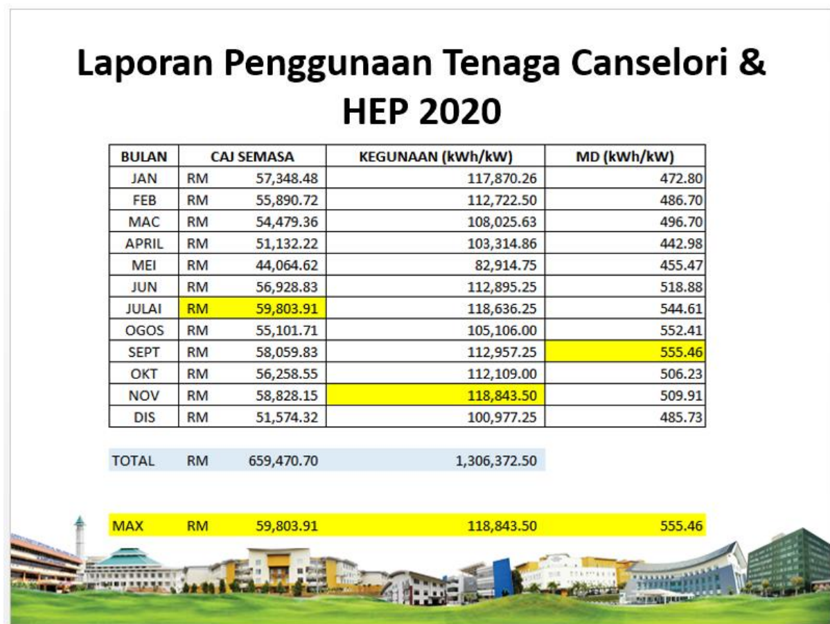
Jadual 1 : Perbandingan secara keseluruhan bagi Caj Semasa, Kegunaan (kWh) dan Kehendak Maksima di bangunan Canselori & HEP pada tahun 2020

Pada tahun 2020, jumlah keseluruhan caj semasa adalah sebanyak RM659,470.70 dengan jumlah penggunaan sebanyak 1,306,372.50 kWh/kW di bangunan Canselori dan HEP. Maksimum Demand (MD) penggunaan tenaga elektrik yang tinggi adalah pada bulan September sebanyak 555.46 kWh/kW dan purata penggunaan tenaga pada bulan November adalah tinggi dengan sebanyak 118,843.50 kWh/kW. Manakala bulan Julai merupakan caj semasa yang tinggi dengan kos sebanyak RM59,803.91. Jadual dibawah menunjukkan perbandingan secara keseluruhan bagi Caj Semasa, Kegunaan (kWh) dan Kehendak Maksima di bangunan Canselori & HEP pada tahun 2020.